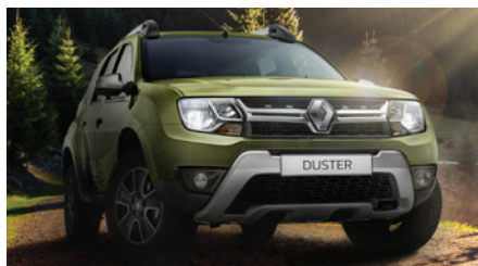
Официальный дистрибьютор Renault в Кыргызстане гарантия 3 года или 100 000 км пробега