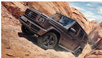
Официальный дилер Daimler Mercedes-Benz гарантия 2 года без ограничения пробега