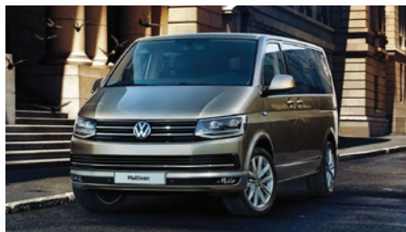
Официальный дистрибьютор Volkswagen Commercial Vehicles гарантия 3 года немецкой уверенности