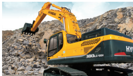
Официальный дистрибьютор Hyundai Construction Equipment гарантия 2 года или 3 000 мото часов