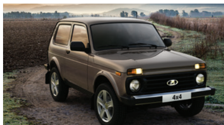
Официальный импортер Lada гарантия 2 года или 35 000 км пробега - Niva 4x4 гарантия 3 года или 50 000 км пробега - Granta, XRAY гарантия 3 года или 100 000 км пробега - Largus

г. Бишкек, ул. Анкара, 5 E-mail: office@asiamotors.kg Tel.: 0(312) 53-00-03 www.asiamotors.kg