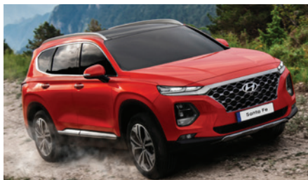
Официальный дистрибьютор Hyundai Motor Company гарантия 5 лет или 100 000 км пробега