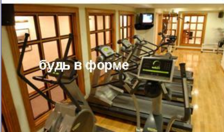
будь в форме

Забронируйте вашу процедуру в регистратуре Клуба Олимпус